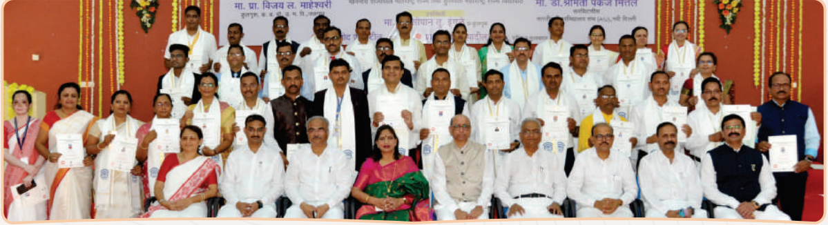
पीएच.डी.प्राप्त विद्यार्थ्यांसमवेत मान्यवर