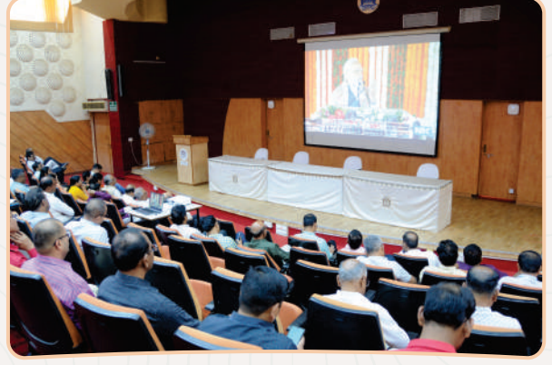
प्रधानमंत्री उच्चतर शिक्षा अभियानाच्या डिजीटल लॉचिंगचे थेट प्रक्षेपण बघण्याची व्यवस्था विद्यापीठात करण्यात आली होती. हे लाईव्ह प्रक्षेपण बघताना विद्यापीठातील शिक्षक, अधिकारी-कर्मचारी.