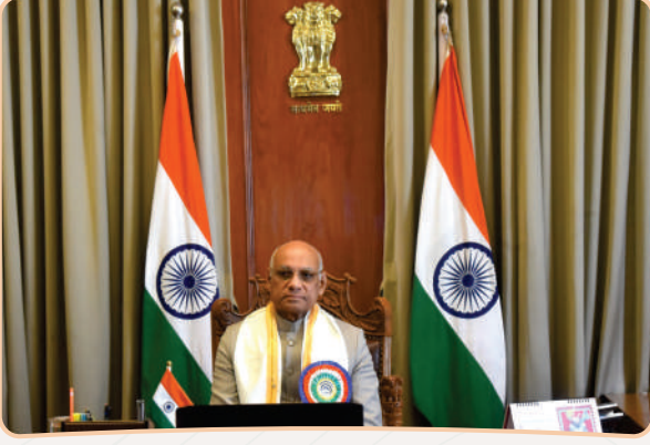
३२ वा दीक्षांत समारंभात विद्यार्थ्यांना ऑनलाईन मार्गदर्शन करताना मा. राज्यपाल रमेश बैस