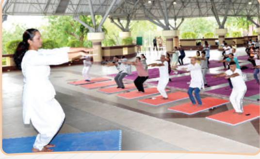
आंतरराष्ट्रीय योग दिनानिमित्त विद्यापीठाच्या योग केंद्रातर्फे योग शिबिर आयोजित करण्यात आले होते. त्यात कुलगुरु, प्र-कुलगुरु, वित्त व लेखाधिकारी, परीक्षा मंडळाचे संचालकांसोबत प्राध्यापक, कर्मचारी व विद्यार्थी सहभागी झाले होते.