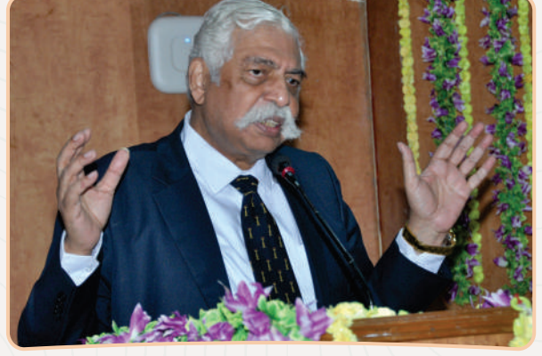
छत्रपती शिवाजी महाराजांच्या लष्करी नीतीवर विद्यापीठात आयोजित राष्ट्रीय चर्चासत्रात मार्गदर्शन करतांना मेजर जनरल जी.डी. बक्षी