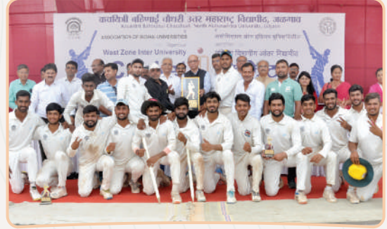
प. विभागीय आंतरविद्यापीठ क्रिकेट (पुरुष) स्पर्धेत विजेता कवयित्री बहिणाबाई चौधरी उत्तर महाराष्ट्र विद्यापीठाचा संघ मान्यवरांकडून पारितोषिक स्वीकारतांना