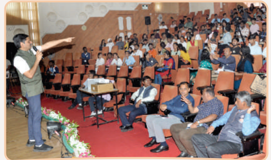
विद्यापीठात आयोजित राष्ट्रीय एकात्मता शिबिरात विद्यार्थ्यांना मार्गदर्शन करताना यजुर्वेद महाजन