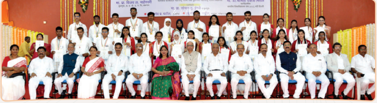
सुवर्णपदक प्राप्त विद्यार्थी व विद्यार्थिनीसमवेत मान्यवर